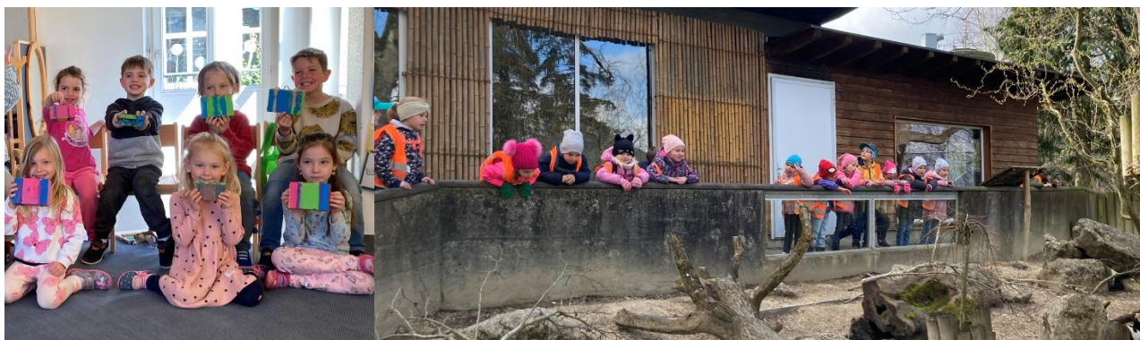
Einblick in die Projektwoche der Primarschule.